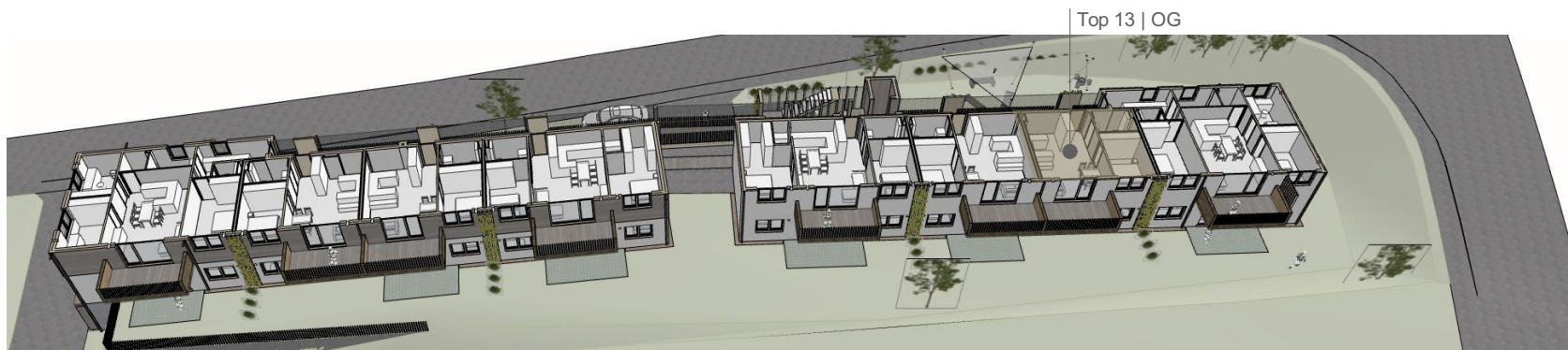
Top 13 | OG